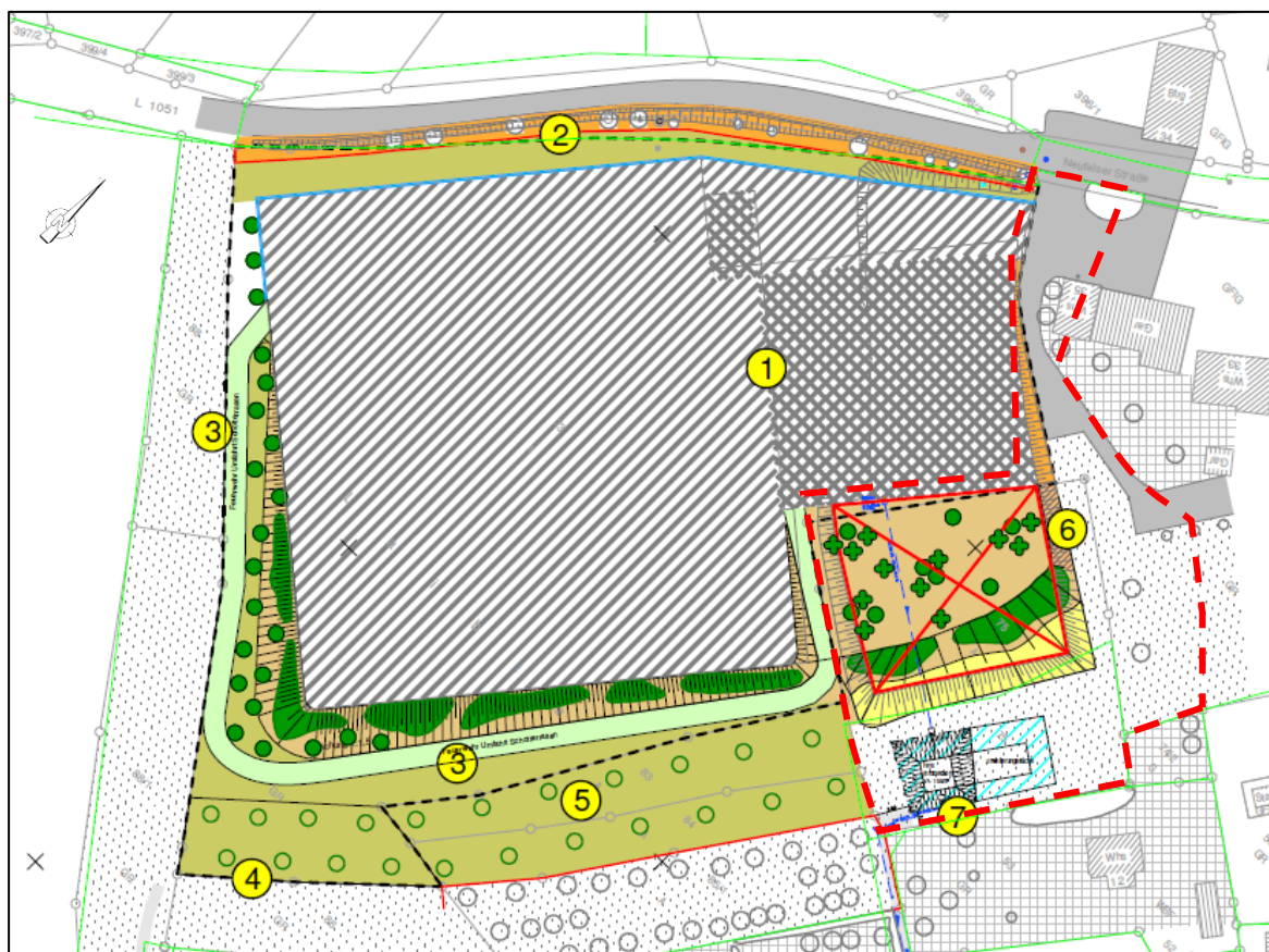
Abbildung 3: Auszug aus dem Grünordnungsplan zum Umweltbericht zum Bebauungsplan „Spedition Heinrich Hamprecht“, Stadt Künzelsau (Planverfasser: Ingenieurbüro Balling GmbH, Stand 05.07.2016, unmaßstäblich) mit ungefährender Lage des Geltungsbereichs des Bebauungsplans „Änderung und Erweiterung Spedition Hamprecht“

Im Rahmen des bestehenden Bebauungsplans „Spedition Heinrich Hamprecht“ mit zugehörigem Umweltbericht und integriertem Grünordnungsplan in der Fassung des Satzungsbeschlusses vom 05.07.2016 wurden im Geltungsbereich des Bebauungsplans sowie auf angrenzenden Flächen grünordnerische Festsetzungen getroffen (vgl. Abbildung 3), die der Minimierung, Vermeidung und Kompensation von Eingriffen in den Naturhaushalt und das Landschaftsbild dienen.