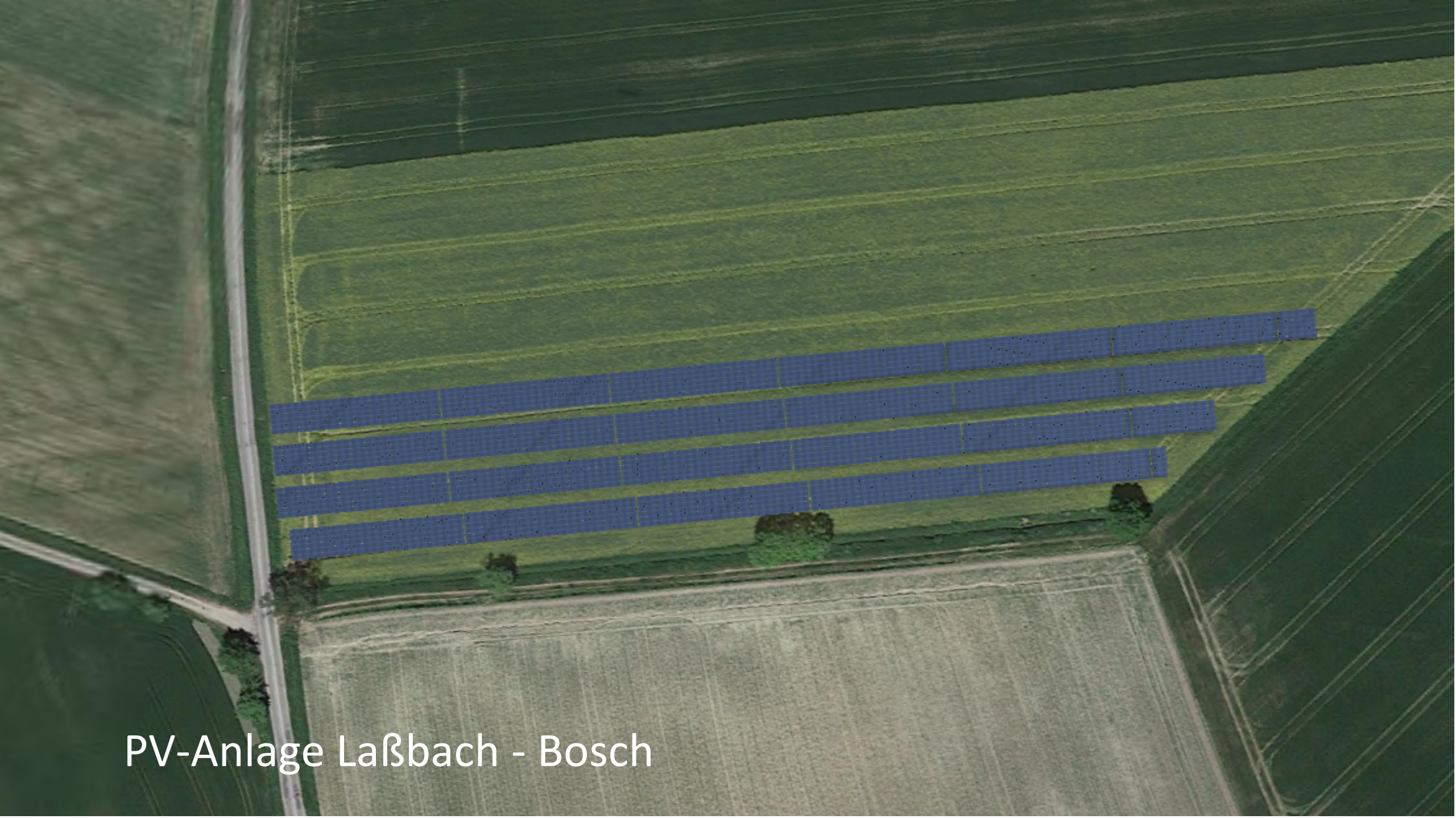
PV-Anlage Laßbach - Bosch